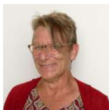
Sandrine LION Maire de Fontevraud l'Abbaye CA SAUMUR VAL DE LOIRE